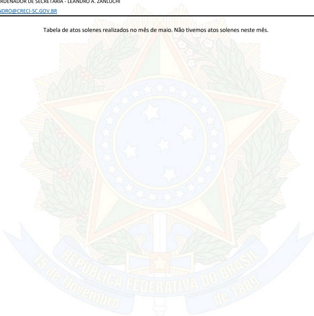
Tabela de atos solenes realizados no mês de maio. Não tivemos atos solenes neste mês.