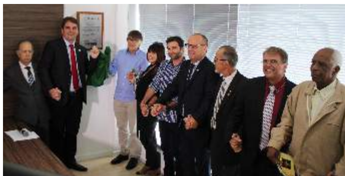
► Rio Grande (8ª Sub-Região) - Sala Lauro Cerqueira de Carvalho

Para utilizar os espaços gratuitamente basta entrar em contato com a delegacia do CRECI-RS de seu interesse e agendar o horário e a data. Informações pelo site: www.creci-rs.gov.br/site/delegacias.php