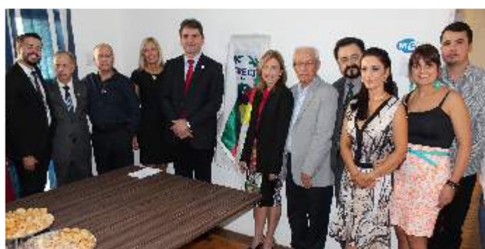
► Pelotas (7ª Sub-Região) - Sala Wilson da Cunha dos Santos